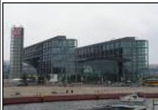
( Hauptbahnhof Berlin )

Hinfahrt: Datum: Freitag, 20. Juli 2007 Uhrzeit: 01:00 Uhr Ort: Dachau, Gröbenrieder Str. 21 ( Parkplatz ASV Dachau ) Ankunft in Berlin: 08:00 Uhr ( geplant ) Rückfahrt: Datum: Sonntag, 22. Juli 2007 Uhrzeit: 14:00 Uhr Ort: Potsdam Ankunft in Dachau: 21:00 Uhr ( geplant )