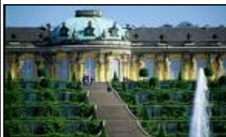
( Schloß Sanssouci-Potsdam )

Im Preis inbegriffen sind: 2 Übernachtungen inkl. Frühstück, alle Eintrittsgelder, zwei Abendessen ( ohne Getränke ) und sämtliche Bus-Reisekosten.